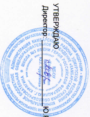
График проведения оценочных процедур в 2, 3, 4, классах МБОУ "Камбарская СОШ № 3 им. Героя РФ Ю. Г. Курягина" на 4 четверть 2023-2024 учебного года