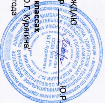
График проведения оценочных процедур в 5,6,7,8,9 классах МБОУ "Камбарская СОШ № 3 им. Героя РФ Ю.Г. Курягина" на 4 четверть 2023-2024 учебного года